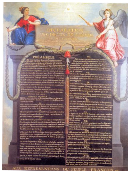
Az Emberi és Polgári Jogok Nyilatkozata